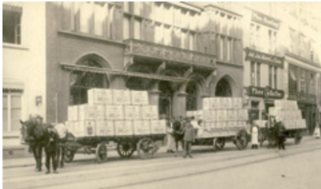
Das Haus in der Glockengasse mit der Hausnummer 4711.