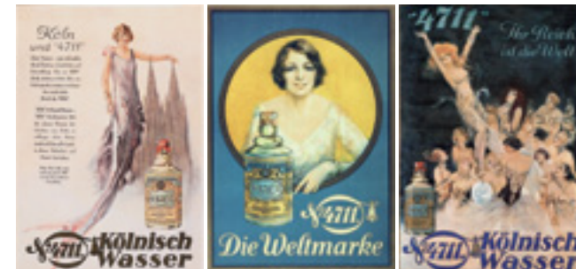
220 Jahre Kulturgeschichte, Leidenschaft und Passion, um die Welt mit besonderen Düften zu verschönern.

So beginnt der Siegeszug einer Marke, die zur „Zahl der Welt“ wird. Mit Niederlassungen rund um den Globus erwächst 4711 in kürzester Zeit zu einer internationalen Größe der Parfum-Welt.