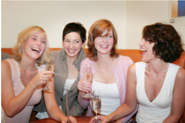
Was sagen Deine Freundinnen und Bekannten?

Nachdem Du Dir eine Meinung gebildet hast, interessiert uns natürlich, was Deine Freundinnen, Bekannten und Kolleginnen sagen.