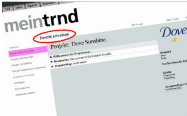
Berichte uns von Deiner Mundpropaganda: im trnd-Mitgliederbereich.

Immer, wenn Du mit Freundinnen, Bekannten oder Kolleginnen über die Dove Sunshine Pflege gesprochen hast, dann schreib uns einen Bericht!