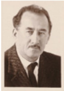
Alfons Loacker fondò l'azienda nel 1925.

«Non dimenticate le vostre radici, mantenete la tradizione, apprezzate la natura come partner e produttore».