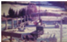
Costruzione dello stabilimento Loacker ad Auna di sotto Sud-Tirolo/Alto Adige.