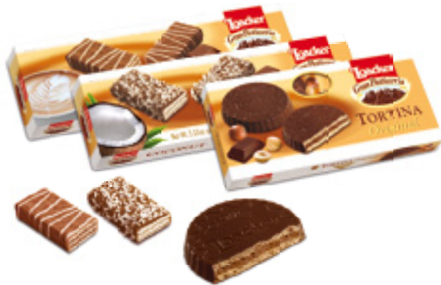
Dell'assortimento Gran Pasticceria fanno parte Patisserie e Tortina.

Gran Pasticceria è la linea di specialità al cioccolato fatta per offrirvi la naturalità e la bontà dei wafer Locker anche in momenti eleganti e raffinati. È disponibile in diversi gusti nelle varianti Patisserie e Tortina.