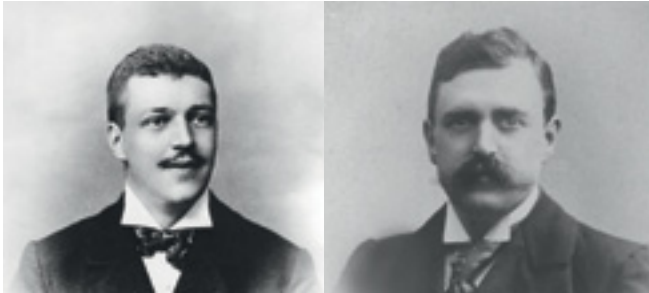
Anton und Gerard Philips gründen 1891 das Unternehmen Philips & Co. in Eindhoven in den Niederlanden.

Anfang des 20. Jh. ist Philips weltweit erfolgreich mit Glühlampen und Radios. Ende der 1930er Jahre widmet das Unternehmen sein Know-how aus der Entwicklung elektronischer Produkte einem ganz anderen Thema: der Haarentfernung.