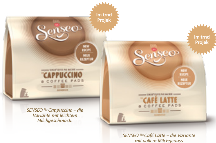
SENSEO Typ Cappuccino – die Variante mit leichtem Milchgeschmack.

Mit den SENSEO Pads Typ Cappuccino und SENSEO Typ Café Latte gelangen die Mischungen aus köstlichem Milchgeschmack und cremigem Schaum in nur einem Schritt – einfach in der SENSEO Padmaschine.